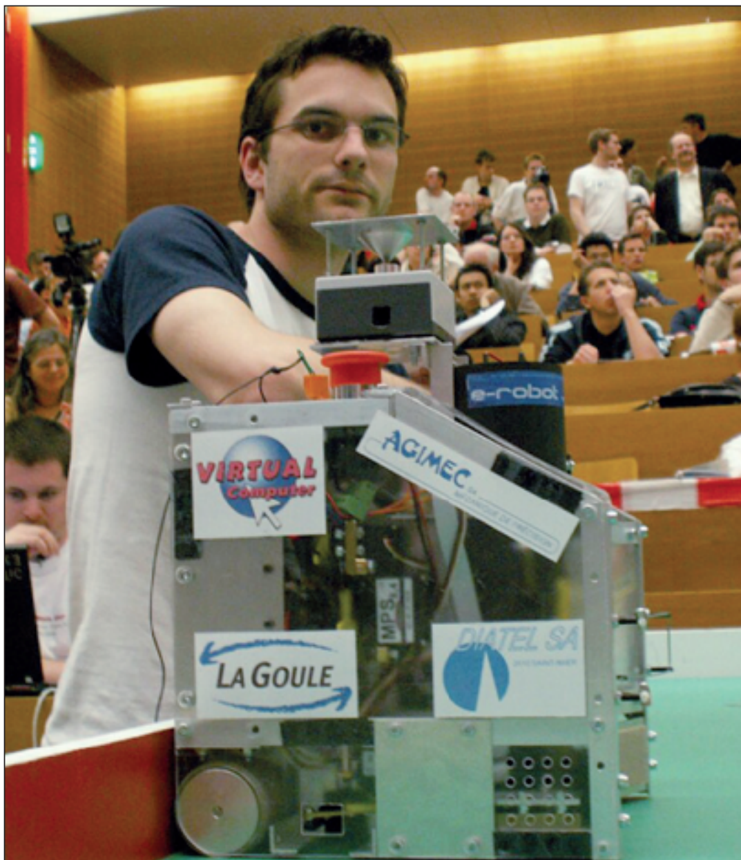
L'Aspiroule, en compétition l'année dernière.

Vous avez peut-être déjà vu à la télévision les matches épiques qui opposent deux robots sur un plateau de jeu, dans une partie de perçage de ballons ou de basket amélioré?